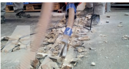
Erstellung des Fugenbetts