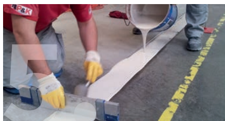
Erstellung der Quiflex-Flüssigfuge