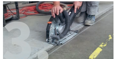
Setzen der Begrenzungsschnitte