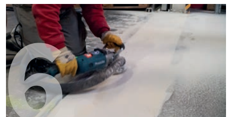
Planschleifen der Fuge