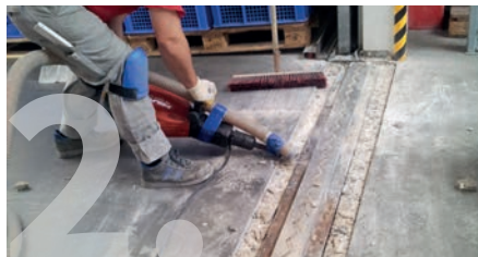
Entfernen der alten Metallfugen